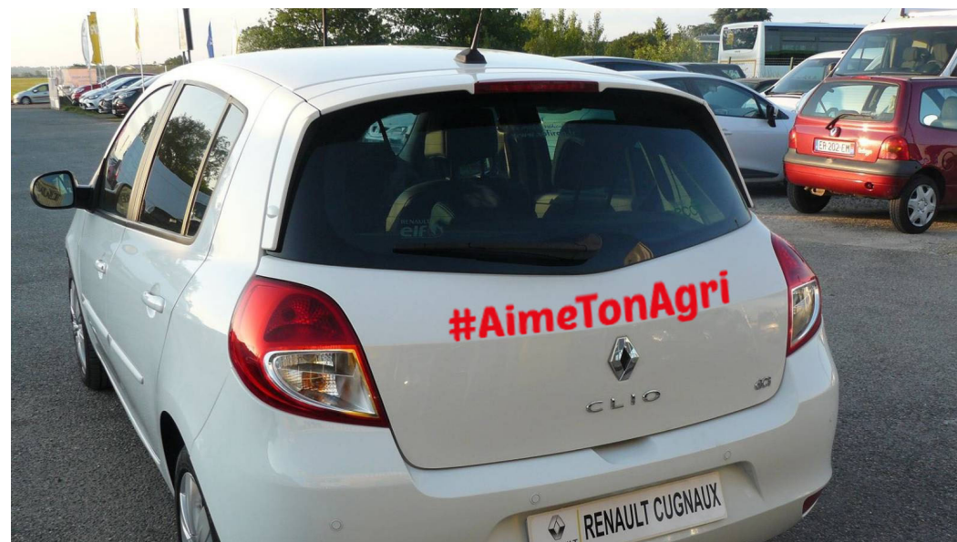
Sur un véhicule